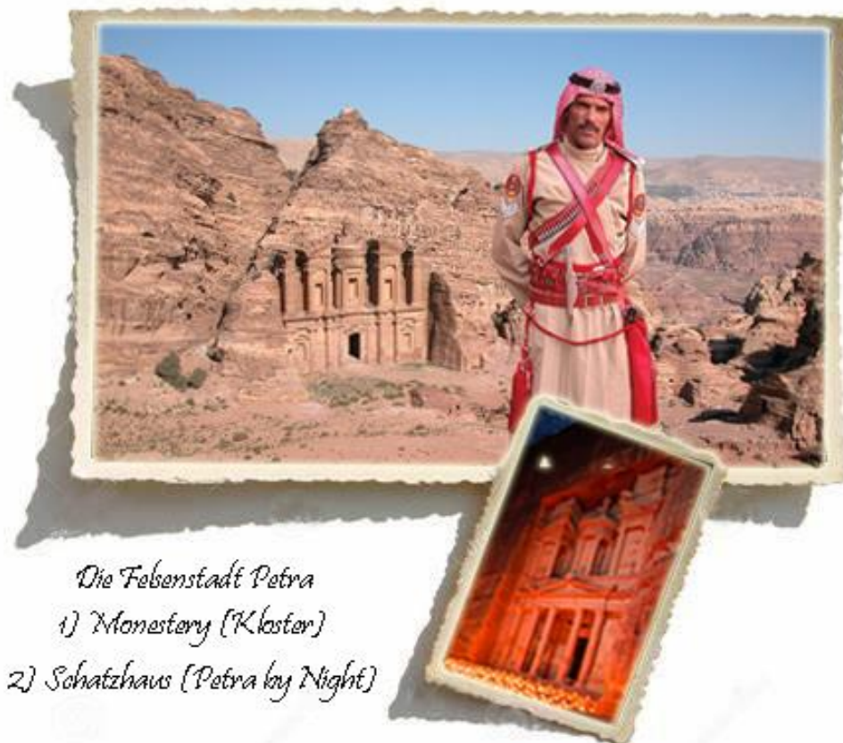
Die Feberstadt Petra

Übernachtung im Captain Hotel*** in Aqaba (Termine 2024 im City Tower Hotel****)